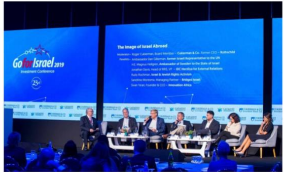
GoforIsrael: צילום: GoforIsrael

לא מעט כבר נאמר על מצב ההייטק הישראלי ועל הירידה שחווה הענף בחודשים האחרונים בהיקף ההשקעות ובכמות העובדים. אחר עשור של עליות ושכירת שייאם, אירועים כמו התקררות שוק הון, עליות הריבית והאינפלציה לצד המלחמה המתמשכת באוקראינה, ממשיכים להשפיע על התעשייה כל העת. לא די בכך, אלא שהרבעון הראשון של 2023 הכניס למשוואה גורם נוסף, הרפורמה המשפטית והחשש מניתוק התעשייה הישראלית מהקאפיטל העולמי.