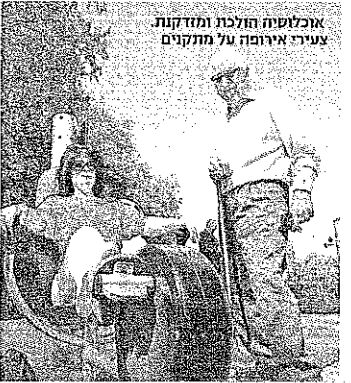
אנכלוסיה חולבת ומתקנת צעירה אירופה על מתקנים

כשיש סאלאם שעולה, גאאות של מתיירים שמכבידים על המערכת הסוציאלית ומשבר כלכלי שסופו מי ישרדו, אין פלא שהימין הקיצוני פורח ברחבי היבשת. גם מתקפות הטרור במדינות ובגולות באמצע העשור לא חרמו לפופולריות של המוסלמים. יש שמשווים את התקופה הנוכחית לימי רפובליקת ויימר בגרמניה, שם עלה הימין הקיצוני בעקבות משבר כלכלי קשה. בעוד אז שימשו היהודים שיער לעוואל, הפעם אלו המוסלמים. התמודדות ברדת הקהל כבר מקבלת ביטוי כלכלי.