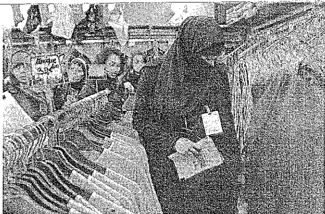
לא נרשמה בעיית ילודה. מוסלמיות בפריז

הנביא ניקולא סרקוזי, איש הימין, נוקט במדיניות פוגיעה בחישים חבתיים כדי להציל את מה שנשאר. מוח זה בא לרוב ביטוי מיוחד בצרפת, שבמינים כתיקונם מקורשת ערכים סוציאליים. בין היתר מתכננת הממשלה שם להעלות את מספרן של שעות העבודה השבועיות, שבעבר ירד ל-35. גם את גיל הפנסיה, שנקבע על 60, מבקשים בצרפת להעלות בשנתיים.